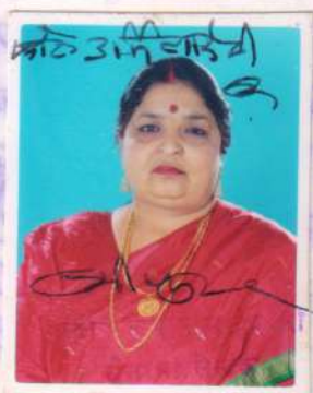
स० कासगंज (एटा)